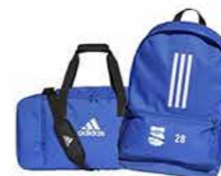
Väska & Rygsäck