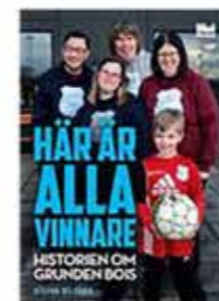
Grunden Bois bok