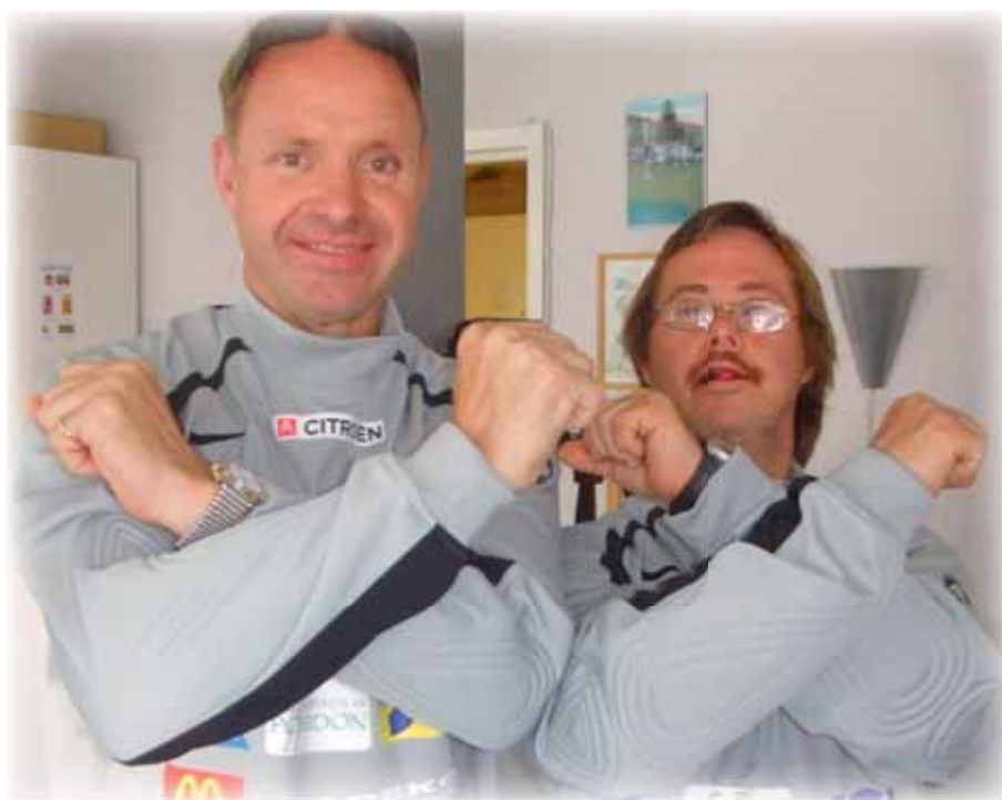
2 x Ravelli släpper aldrig in några mål.

Visste du att Thomas Ravelli: har 7,4 handikapp i golf, helst vill ta med idrottsstjärnan Kirsten Berlin på bal, vill inte bli någon kalsongmodell i tidningen Slitz, aldrig ägt en moppe (hans pappa var läkare, visste hur farligt de var med moppar), skolkat från skolan 1 gång, har spelat mot Trinidad Tobago i en landskamp 1983 och vann med 5-0, tycker Grunden Bois är bättre än FCZ, håller givetvis på Frölunda Indians och IFK Göteborg.