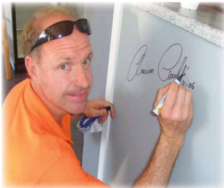
Ravelli skriver autograf på Grunden Bois bardisk.