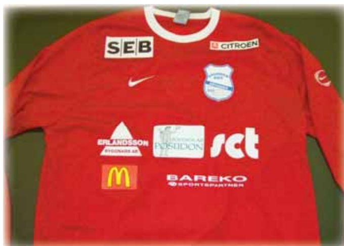
Nya röda tröjan