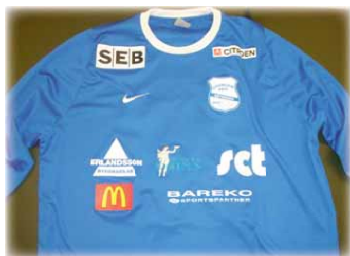
Nya blåa tröjan