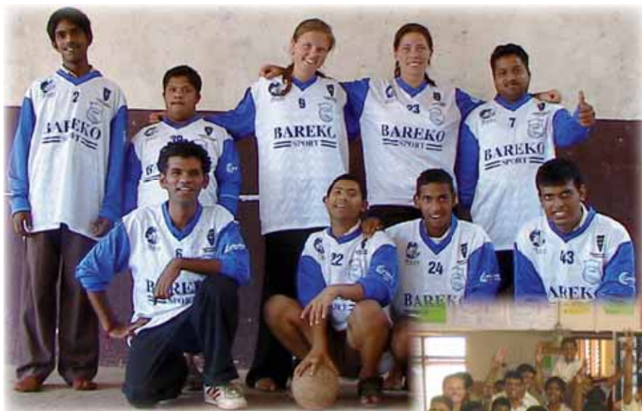
Grunden BOIS indiska upplaga.

Vi blev varmt bemötta av både lärarna och eleverna. Relationen mellan lärare och elever var okomplicerad p.g.a. av tydliga gränser men samtidigt fanns det ingen rädsla utan bara respekt. Därför var det inga större problem för oss att hålla i lektioner eftersom eleverna var både väluppfostrade och nyfikna på oss. Vi fick undervisa i matte, engelska, stavning & idrott. Dom hade en hel del friskvård på schemat och utövade många olika sporter. Eftersom vi hade med oss Grunden Bois gamla matchtröjor som en liten gåva så var det givet att dra igång en fotbollsmatch. Eleverna blev överlyckliga när dom fick dra på sig riktiga matchtröjor och springa ut på planen. Matchen var svettig med tanke på att det var 35 grader varmt, men vi kämpade på och Grunden Bois laget segrade. Hela vistelsen i Indien var en riktig utmaning både på gott och ont, en resa som alltid kommer ligga oss varmt om hjärtat.