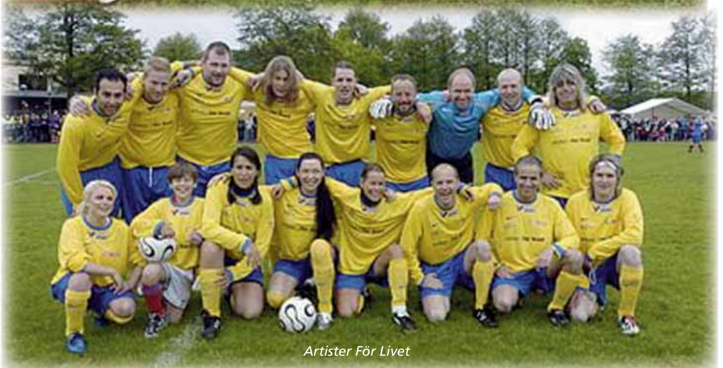
Artister För Livet