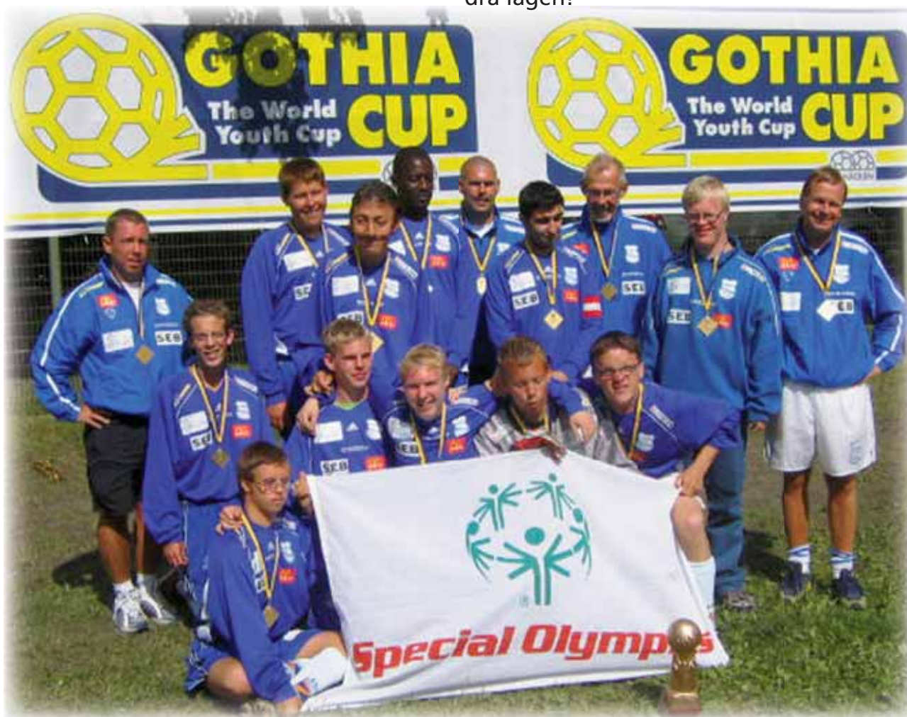
Grunden BOIS segrande lag i Gothia Cup 2005.

Kom nu och heja på Grunden Bois och de andra lagen!