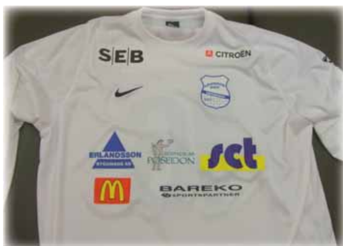
Nya vita tröjan