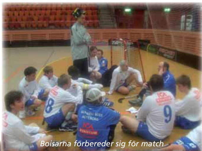
Boisarna förbereder sig för match