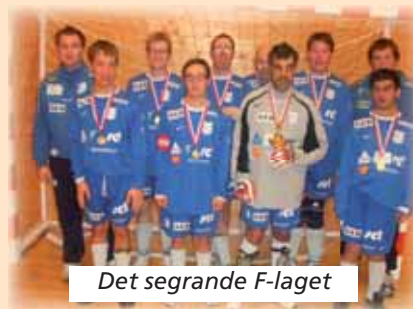
Det segrande F-laget