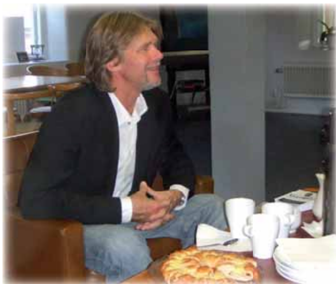
Glenn blir intervjuad