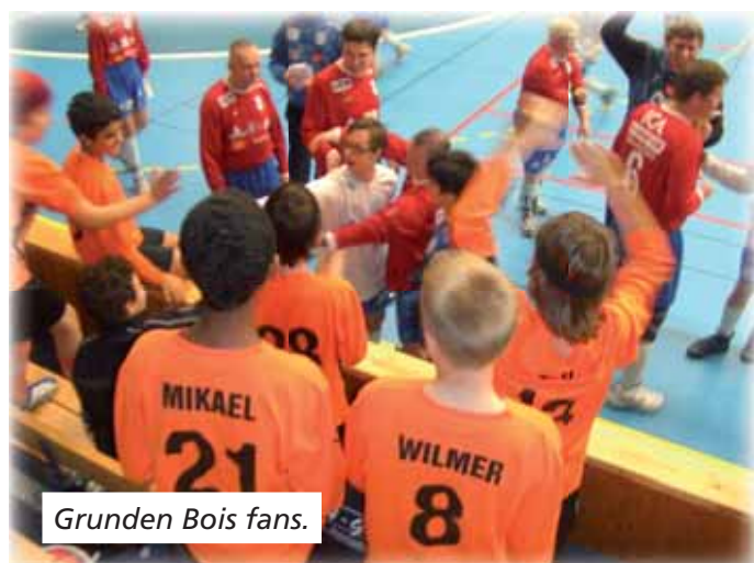
Grunden Bois fans.