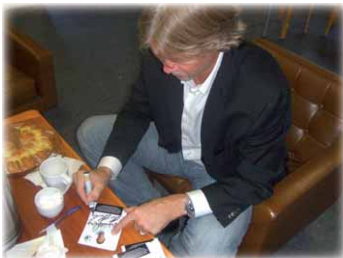
Signering av idolkort

- Nej, eller jo...En gång ändrade jag inställningen på videon, när hon skulle visa en tråkig film som ingen av oss ville se. När hon tryckte på play så blev det bara svart i rutan.