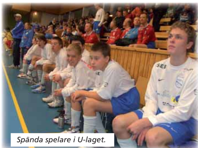
Spända spelare i U-laget.

Nu hoppas vi alla att traditionen, Lucia Cupen, kommer att fortsätta för alltid!