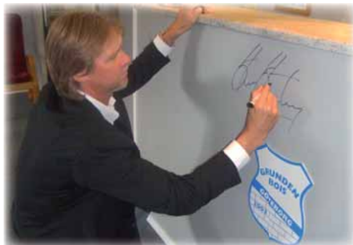
Strömberg skriver autografen på Bois bardisk

Ett annat härligt minne är cupvinnare cupfinalen när vi i Atalanta mötte Mechelen på vår hemmastadion.