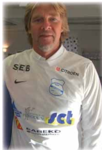
Signore Strömberg i Bois matchtröja