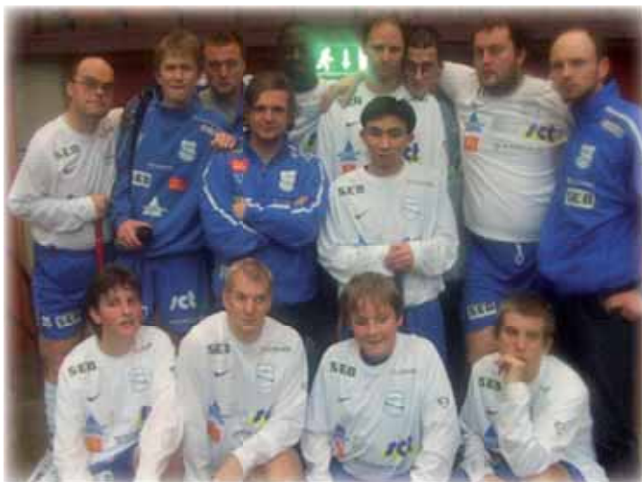
Hela laget samlat