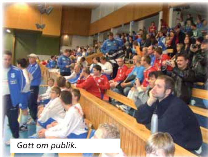
Gott om publik.