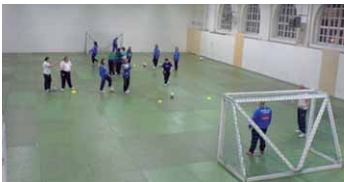
Damerna kör sin första träning, på det nylagda golvet