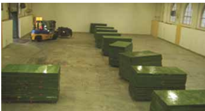
Golvet på väg att läggas ut