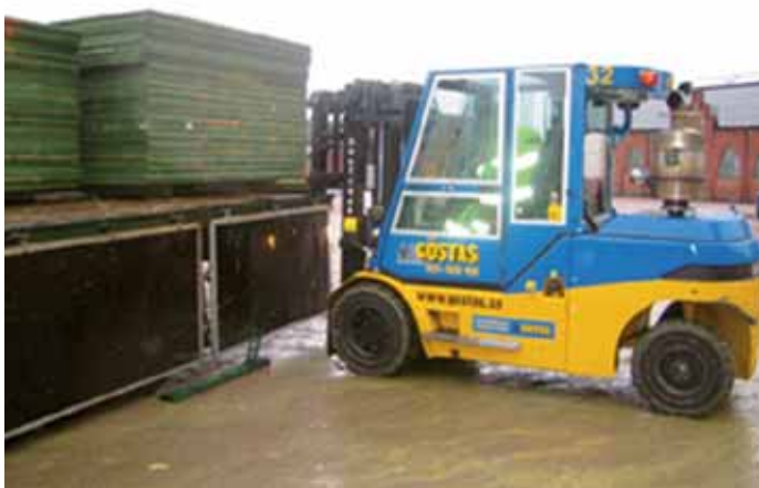
Golvet lossas från lastbilen

Idrotts & Föreningsförvaltningen & Higab.