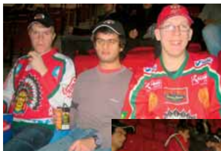
Grunden Bois E-lag i Scandinavium & tittar på Frölunda Indians.