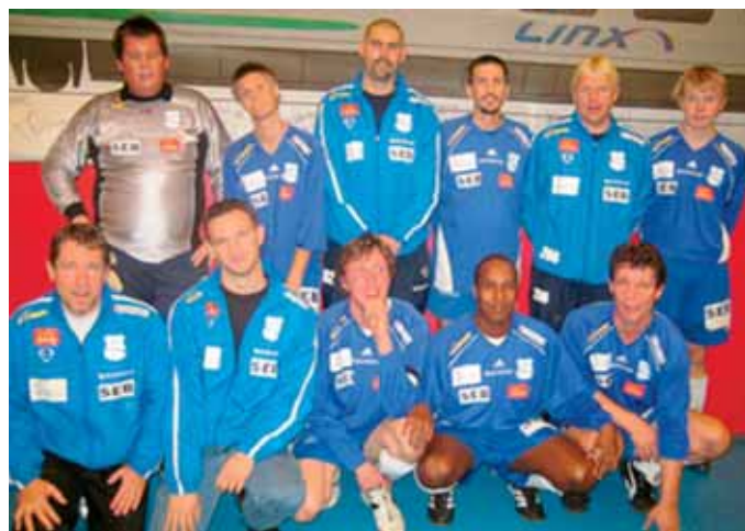
Grunden Bois spelare som deltog i SJ Cupen 2005